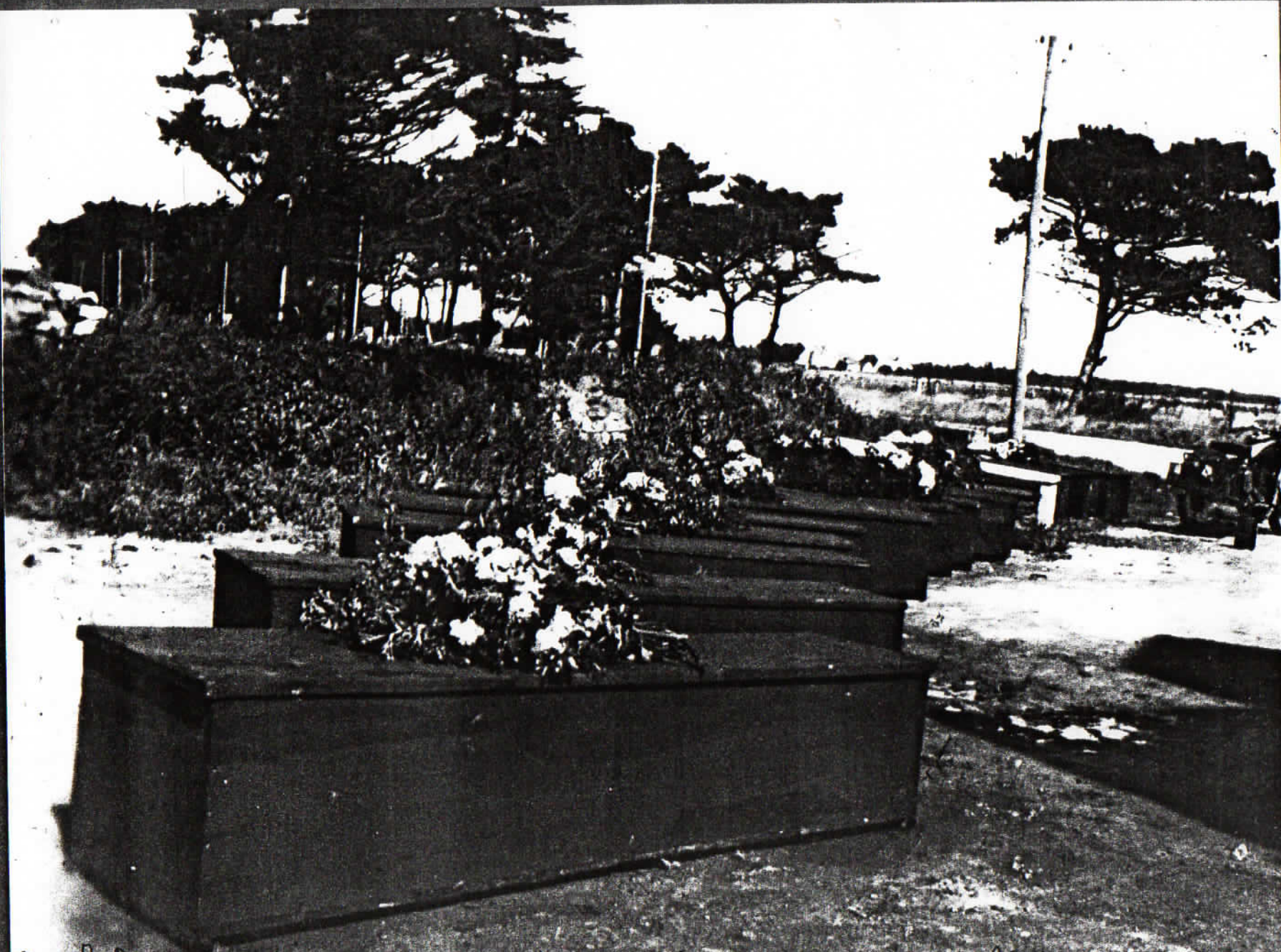
Coréens des 15 résistants torturés assassinés le 15 mai 1944 sur la dune plage à la pointe de Kousterim Foumeau -