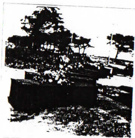
Entassement des cadavres dans la fosse le port de l'écume par le lieu de Foucault le 17 septembre. Ce dessein d'arrangement de monument de la suite de la mort Mortuus être le 18 mai 1944 elle n'est pas.