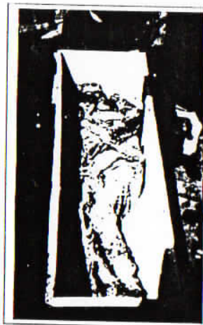
Détrement des corps et mise en bière L'alleuxer pressés.